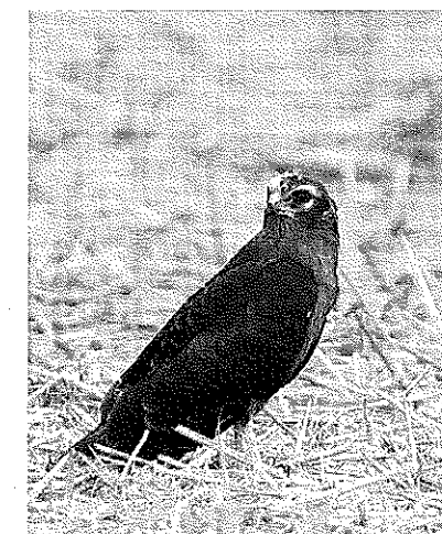
Le busard cendré va-t-il disparaître ?